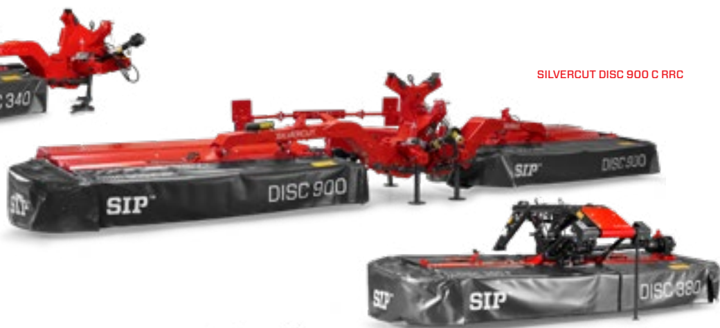
SILVERCUT DISC 900 C RRC