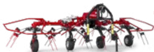
SPIDER 400|4 ALP