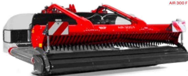
AIR 300 F