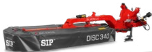
SILVERCUT DISC 340 S