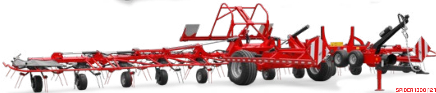
SPIDER 1300|12 T