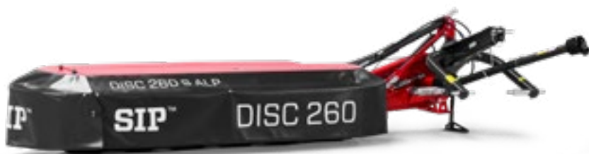
DISC 260 S ALP