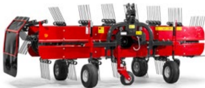
FAVORIT 274 ALP