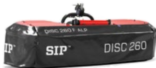
DISC 260 F ALP