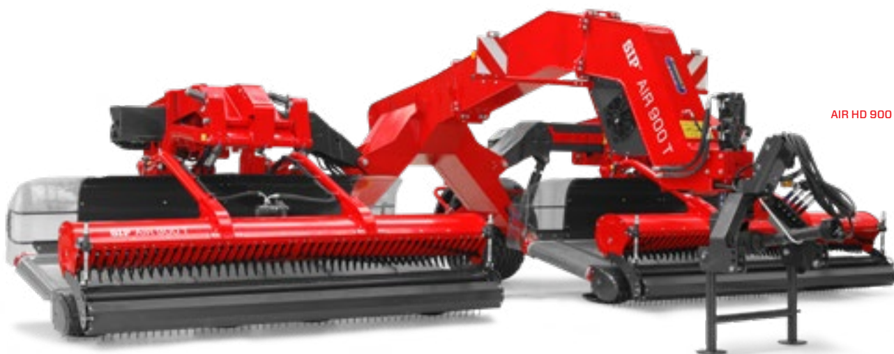
AIR HD 900 T